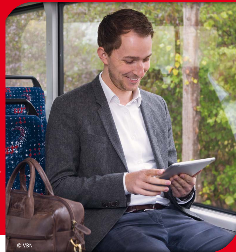
Stand 11/2018 · Änderungen vorbehalten