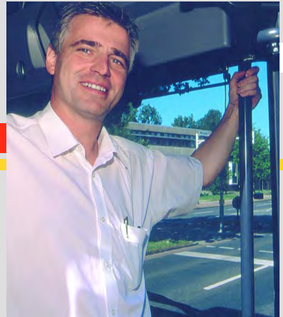
Unsere Fahrer/-innen helfen Ihnen weiter.

Wenn Sie weitere Faltblätter zum Thema »Qualität verbindet« anfordern möchten, rufen Sie uns einfach an.