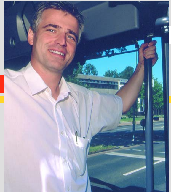
Unsere Fahrer/-innen helfen Ihnen weiter.

Wenn Sie weitere Faltblätter zum Thema »Qualität verbindet« anfordern möchten, rufen Sie uns einfach an.