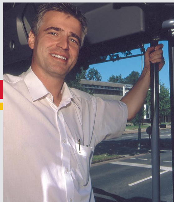
Unsere Fahrer/-innen helfen Ihnen weiter.

Wenn Sie weitere Faltblätter zum Thema »Qualität verbindet« anfordern möchten, rufen Sie uns einfach an.