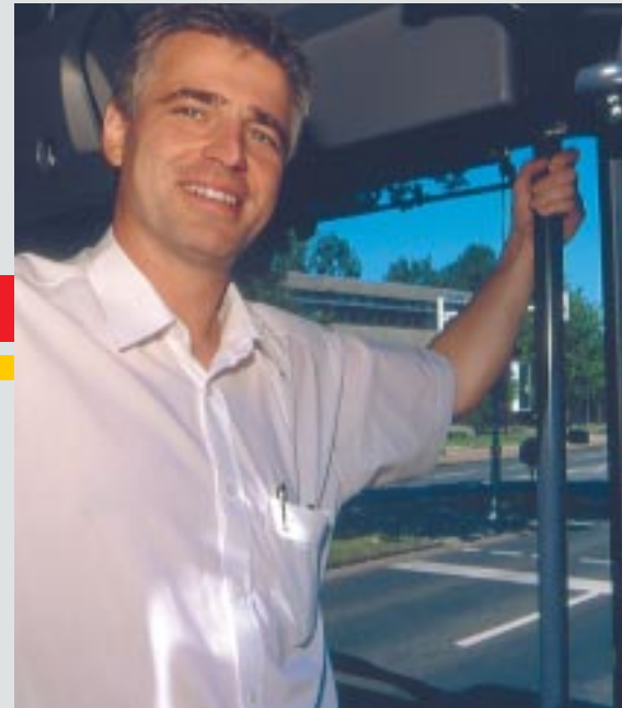
Unsere Fahrer/-innen helfen Ihnen weiter.

Wenn Sie weitere Faltblätter zum Thema »Qualität verbindet« anfordern möchten, rufen Sie uns einfach an.